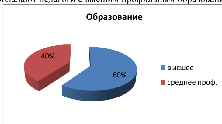
Рис.3 Образовательный ценз

В детском саду преобладают педагоги с высшим профильным образованием ( рис. 3 ).