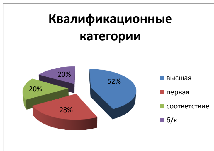
Рис 2. Результаты аттестации

В детском саду преобладают педагоги с высшим профильным образованием ( рис. 3 ).