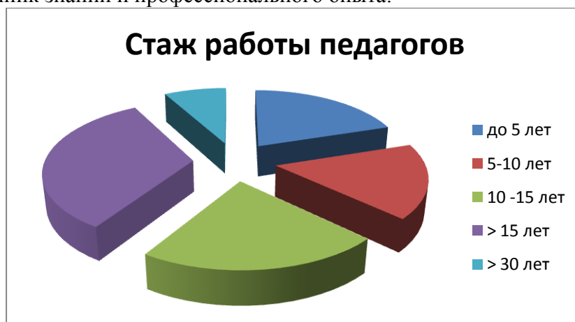
Рис. 4 Стаж работы педагогов

В детском саду № 194 «Капитошка» большинство педагогов имеют стаж работы более 15 лет ( рис. 4 ). Есть и молодые кадры, являющиеся залогом будущего развития, и педагогическая молодежь - источник знаний и профессионального опыта.