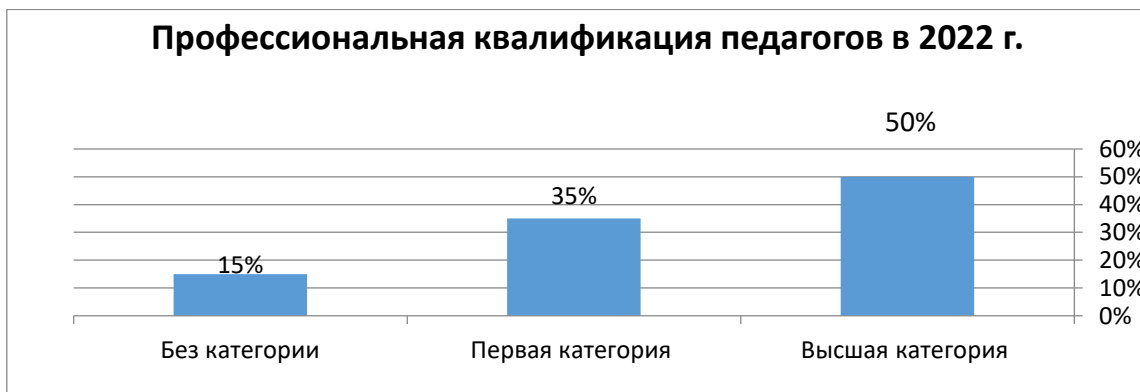
Рисунок 4 - профессиональная квалификация педагогов в 2022 г

Педагоги детского сада имеют среднее специальное и высшее профильное образование (таблица 4).