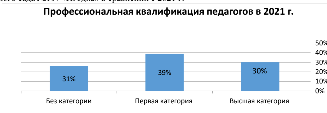
Рисунок 3 - профессиональная квалификация педагогов в 2021 г

Ниже на рисунках 3,4 представлена профессиональная квалификация педагогов детского сада №107 «Ягодка» в сравнении с 2021 г.