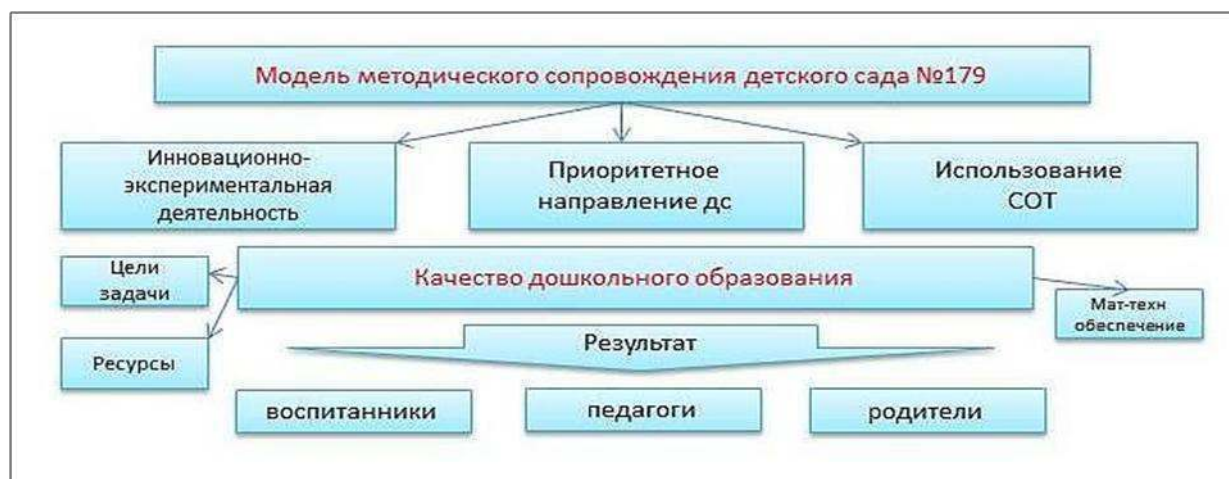
Рисунок 2. Модель методического сопровождения педагогического коллектива ДС № 179 «Подснежник»

Методическое сопровождение по повышению профессионального мастерства педагогов, развитие их творческого потенциала и повышение качества и эффективности образовательного процесса, в том числе и с детьми ОВЗ представлено на рисунке (Рисунок 2)