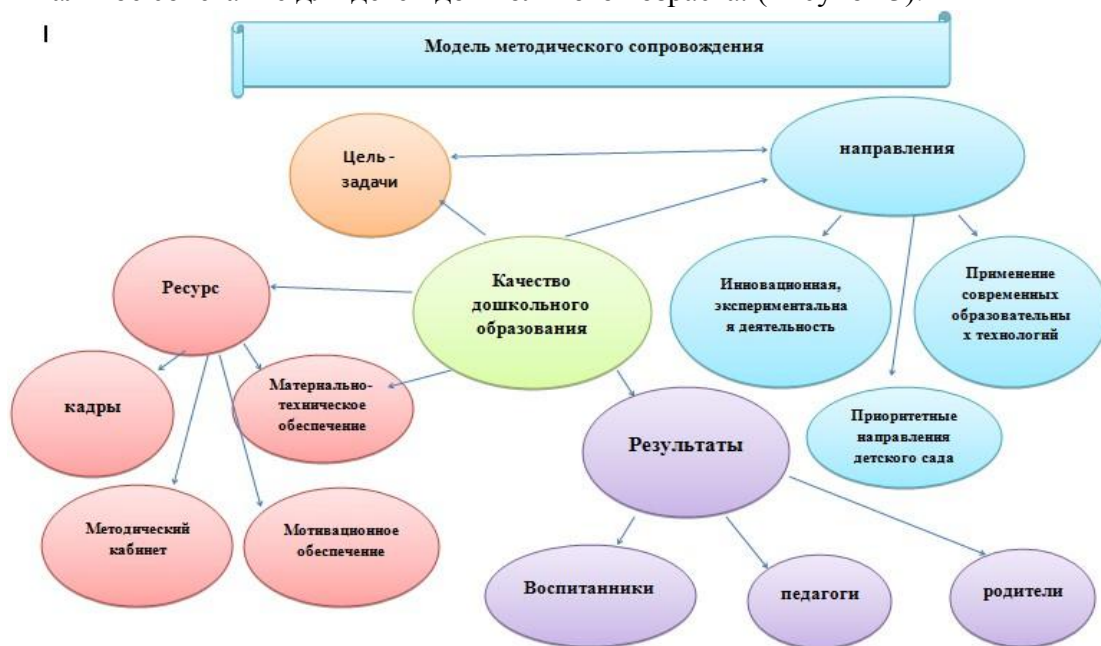
Рисунок 3. Модель методического сопровождения детского сада №179 «Подснежник»

Система методической работы в детском саду обеспечивает непрерывное профессиональное развитие педагогов, а, следовательно, стимулирует оптимизацию в образовательной системе детского сада форм, технологий, методов и средств обучения, их целесообразный выбор и оптимальное сочетание для детей дошкольного возраста. (Рисунок 3).