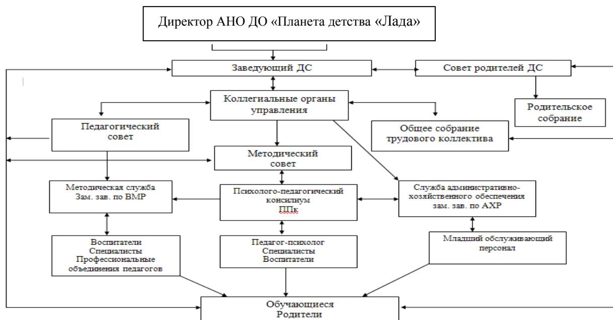
Рисунок 1. Система управления детского сада № 179 «Подснежник»

Управление детским садом строится на принципах единоначалия и коллегиальности. Компетенция органов управления определена согласно Уставу АНО и функциональным задачам детского сада. Модель системы управления детского сада представлена на рисунке 1.