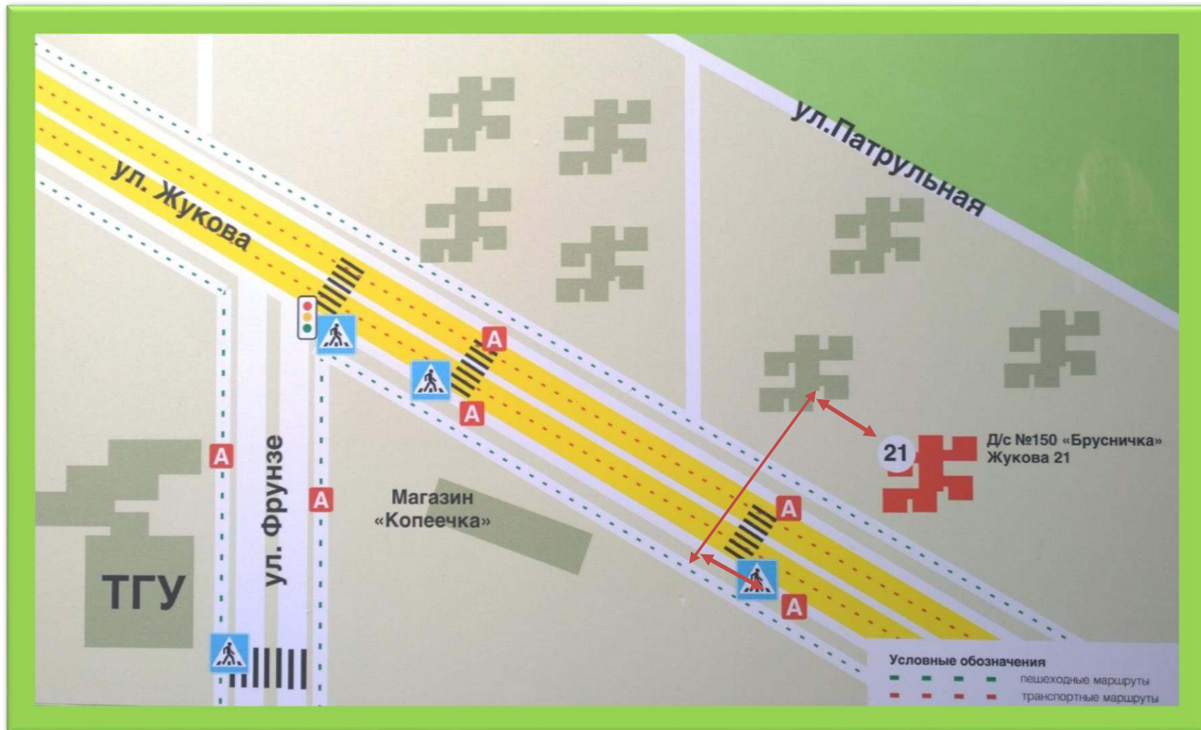
Схема расположения детского сада №150 «Брусничка АНО ДО «Планета детства «Лада» с указанием безопасного маршрута движения воспитанников по регулируемому и нерегулируемому пешеходным переходам

2. Схемы организации дорожного движения в непосредственной близости от детского сада с размещением соответствующих технических средств, маршруты движения обучающихся и расположение парковочных мест