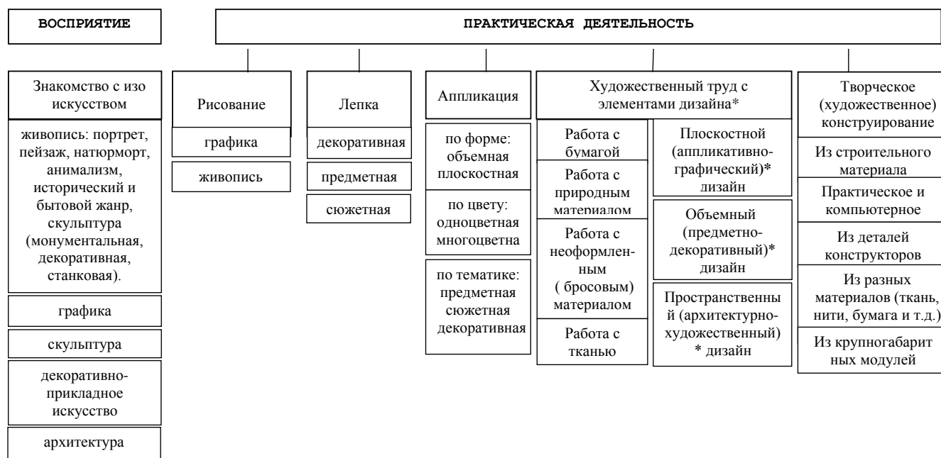
Таблица 17. Используемые изобразительные техники и приемы