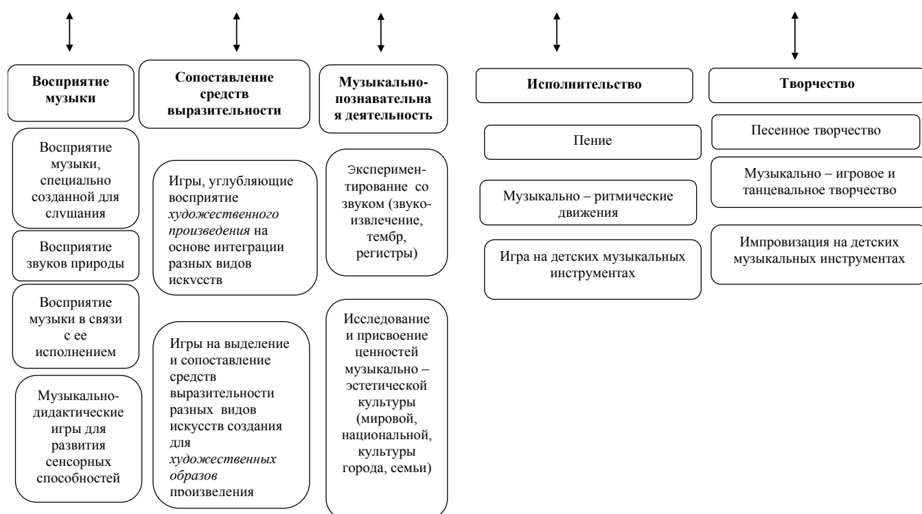
Рисунок 2. Составляющие компоненты образовательной работы направления «музыкальное развитие»