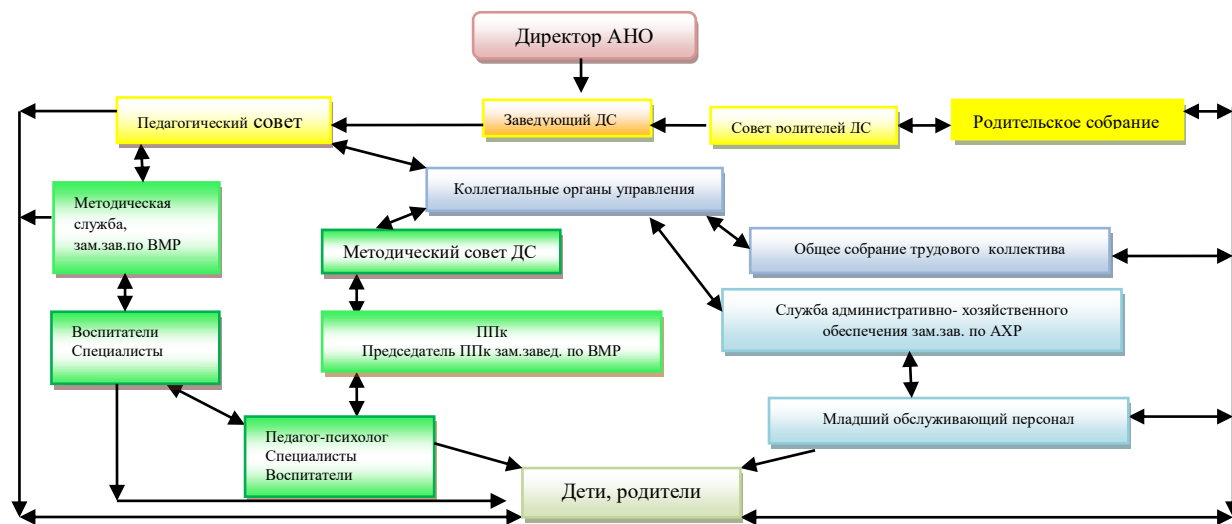
Рисунок 1. - Модель системы управления детского сада №159 «Соловушка»

Руководство деятельностью коллектива осуществлял заведующий детским садом, который непосредственно руководит детским садом и несет ответственность за деятельность детского сада. В детском саду осуществлял деятельность Совет родителей, родительское собрание, которые оказывали содействие по совершенствованию образовательного процесса, взаимодействию родительской общественности с коллективом детского сада (Рисунок 1).