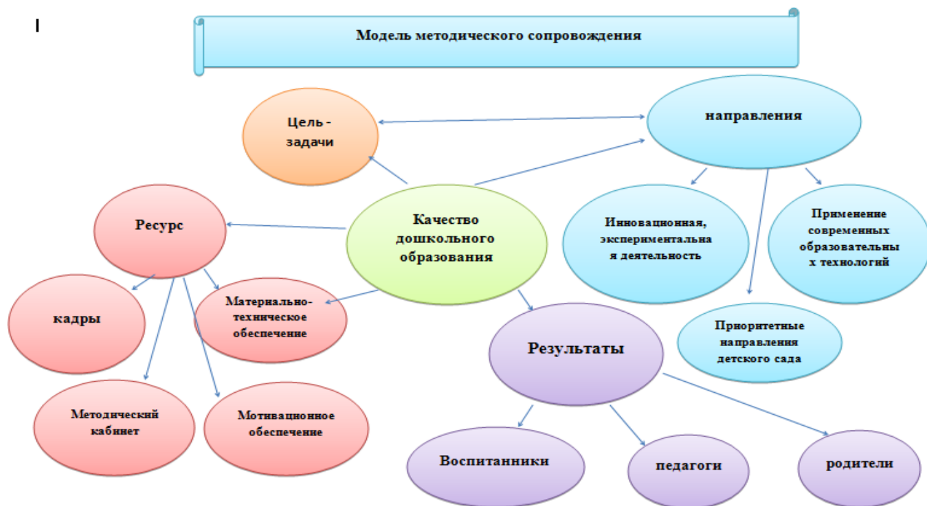
Рисунок 4. – Модель методического сопровождения

Система методической работы в детском саду обеспечивает продвижение профессионального развития как отдельных педагогов, так и оптимизацию в образовательной системе детского сада форм, технологий, методов и средств обучения, их целесообразный выбор и оптимальное сочетание для детей дошкольного возраста (Рисунок 4).