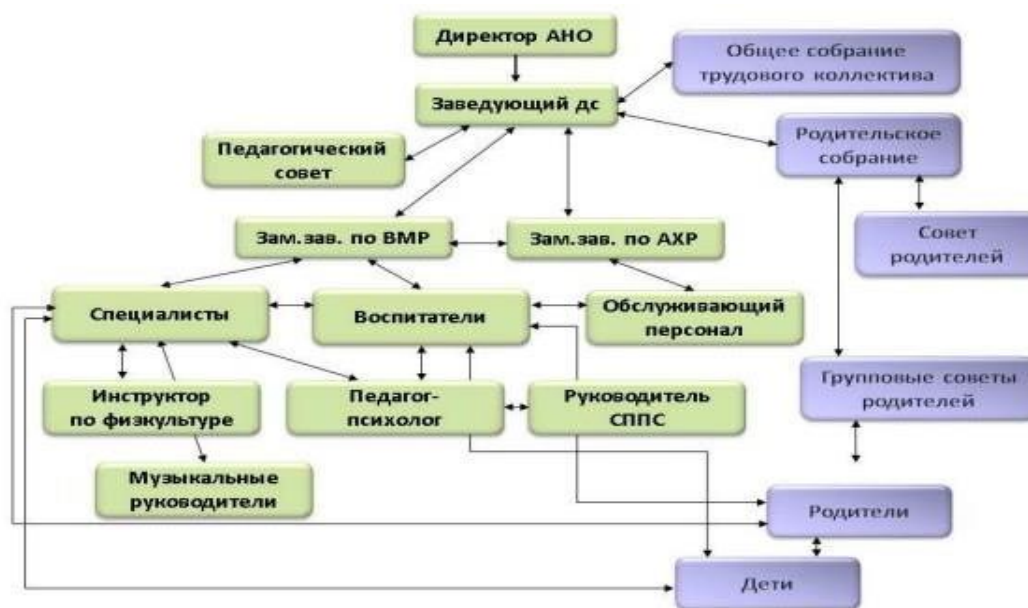
Рисунок 1 – Система управления в ДС 175 «Полянка»

Обеспечение общественного характера в системе управления детским садом достигается через деятельность органов общественного соуправления: общее собрание трудового коллектива, педагогический совет детского сада и представительские органы: совет родителей детского сада, родительское собрание.