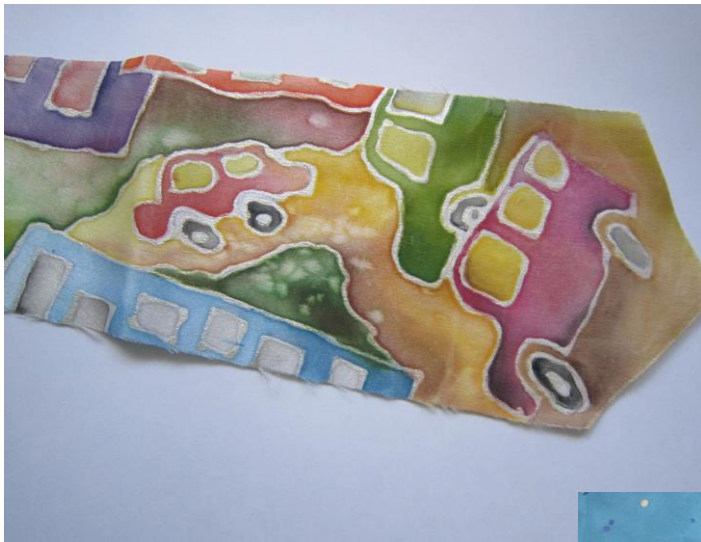
«Галстук для папы», холодный батик работа Калинкиной Т. 7 лет.