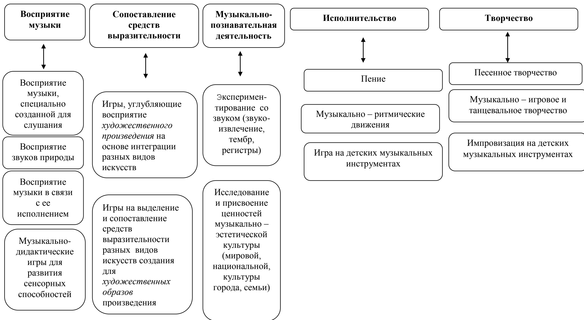
Рисунок 2. Составляющие компоненты образовательной работы направления «Музыкальное развитие»