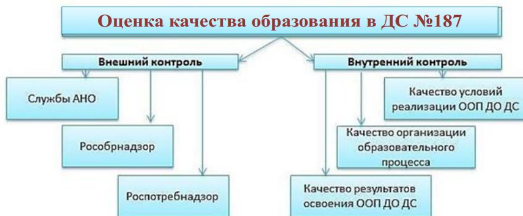
Рисунок № 2 – Оценка качества образования в детском саду № 187.