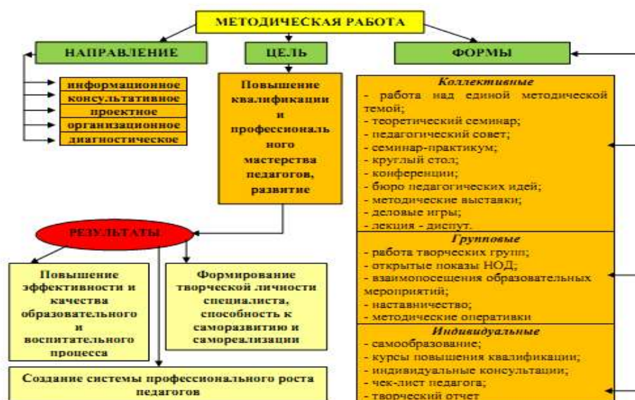
Рис. 2. Система методической работы

Во многом этому способствует сложившаяся в детском саду система методической работы , обеспечивающая положительные результаты воспитательно-образовательного процесса (Рис.2).