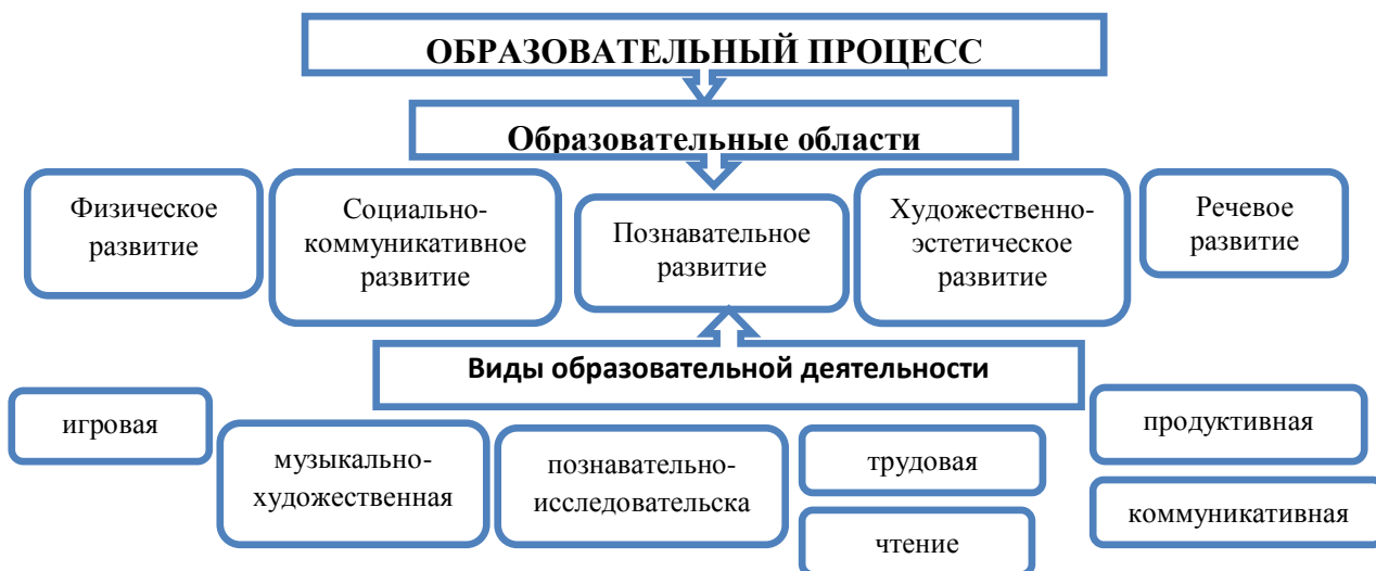
Рисунок 2 - Модель образовательного процесса

В работе с детьми общеразвивающих групп реализуется: Основная общеобразовательная программа дошкольного образования детского сада №146.