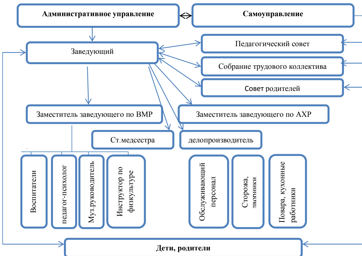
Рисунок 1 – Система управления детского сада № 146 «Калинка»

Действующая организационно-управленческая структура направлена на повышение имиджа учреждения, выполнение социального заказа, улучшения условий пребывания детей, повышение качества образовательных услуг (Рисунок 1).