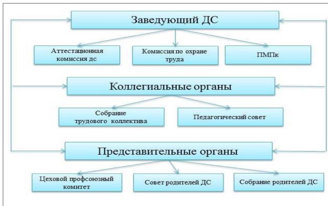
Рисунок 1 – Система управления детского сада

Функциональная система управления детского сада представлена следующими органами: