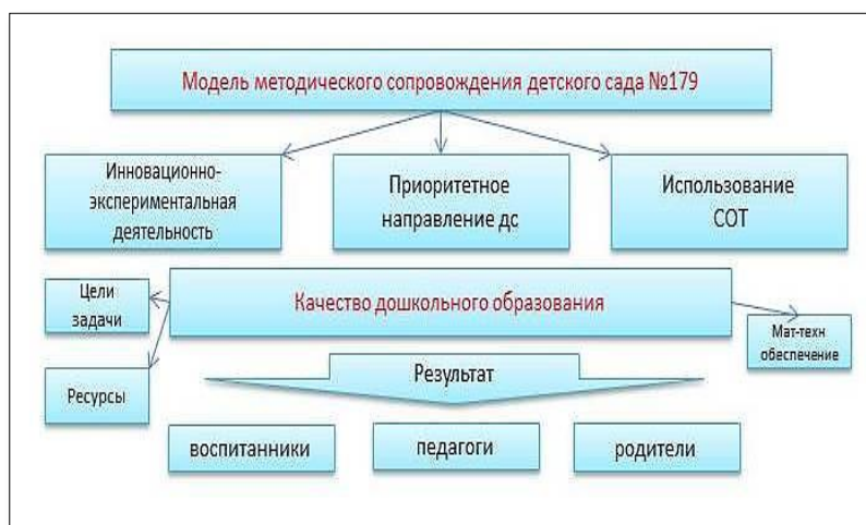
Рисунок 3 – Модель методического сопровождения

В детском саду осуществляется методическое сопровождение педагогов направленное на повышение профессионального мастерства каждого педагога, на развитие творческого потенциала всего педагогического коллектива, повышение качества и эффективности образовательного процесса (Рисунок 3).