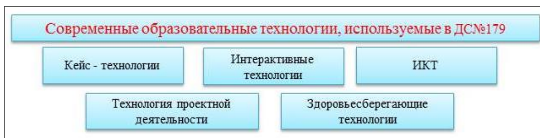
Рисунок 2 – Современные образовательные технологии

В работе с детьми педагоги использовали как традиционные, классические методики, так и современные образовательные технологии (Рисунок 2).