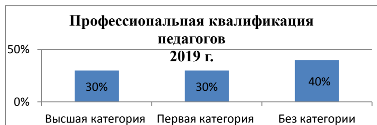
Рисунок 3 - профессиональная квалификация педагогов

Ниже на рисунке 3 представлена профессиональная квалификация педагогов детского сада №107 «Ягодка».