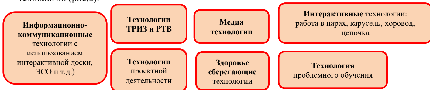
Рисунок 2. СОТ

Повышение эффективности образовательного процесса происходит благодаря внедрению в воспитательно-образовательный процесс д/с современных педагогических технологий (рис.2).