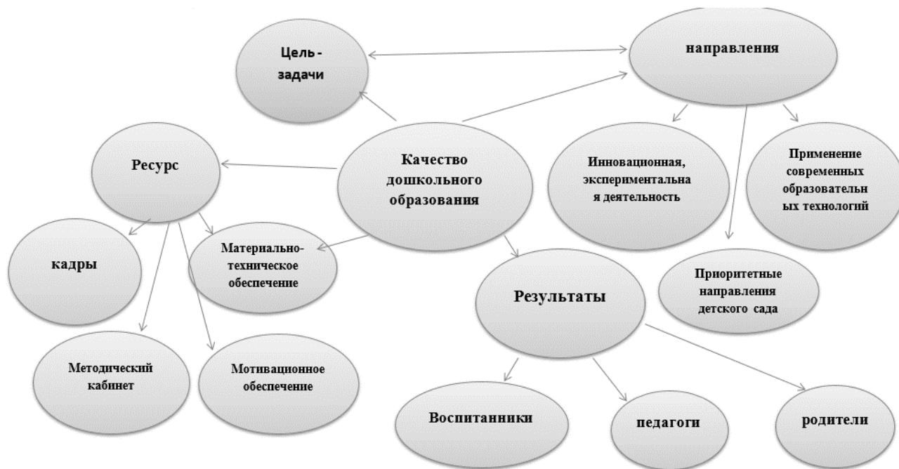
Рисунок 3 – Модель методического сопровождения

семинары, методические объединения в рамках АНО ДО «Планета детства «Лада»; курсы повышения квалификации; презентации опыта работы через публикацию статей в сборниках научно-практических конференций и социальных сетей работников образования (Рисунок 3).