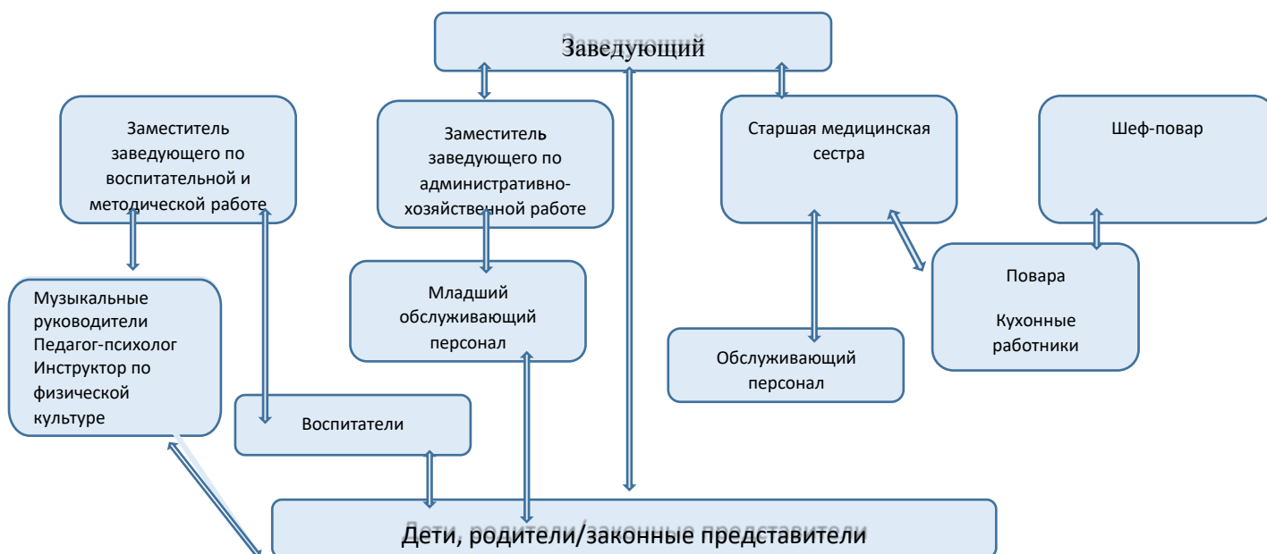
Рис.1 Структура управления д/с № 72 «Подсолнушек»

Руководство детским садом осуществляет заведующий, заместитель заведующего по воспитательной и методической работе, заместитель заведующего по административно-хозяйственной работе, заместитель заведующего по административно-хозяйственной работе. Формы соуправления представлены Советом родителей, общим собранием трудового коллектива, педсоветом и ПМПк (рисунок 1.)